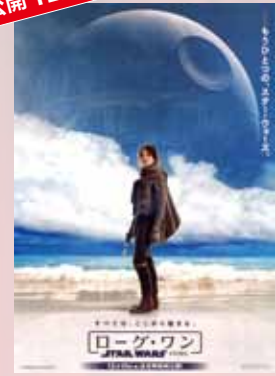
ローグ・ワン STARWARS STORY