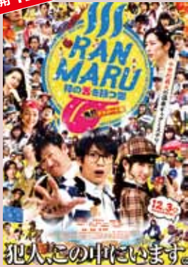
RANMARU 神の舌を持つ男 鬼灯テスロード編