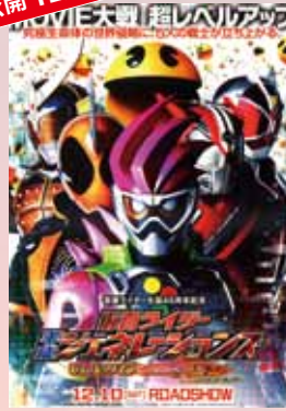
仮面ライダー 平成ジェネレーションズ