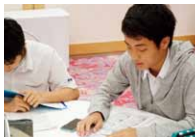
08:30 ~ 10:00... グループワーク⑤