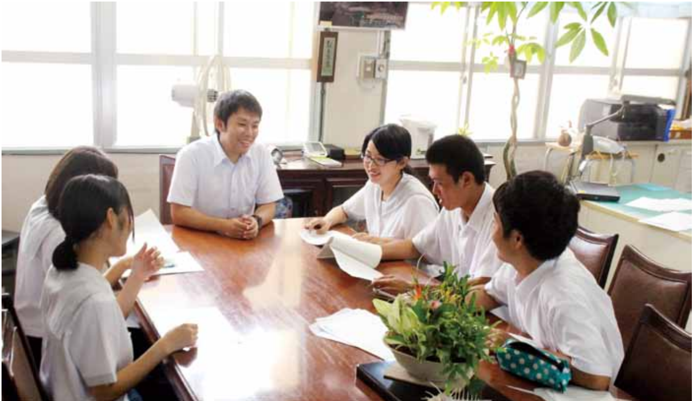
↑学部研究会に参加後、それぞれの今の想いや感想、今後の決意を語り合いました。