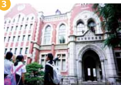
17:45 ~ 18:30... 慶応義塾大学見学③