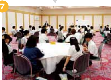
21:00 ~ 22:00... グループワーク⑦