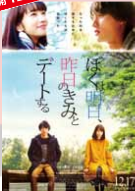
ぼくは明日、 昨日のきみとデートする