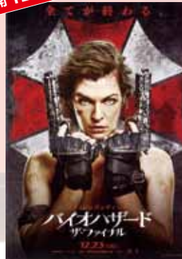
バイオハザード ザ・ファイナル