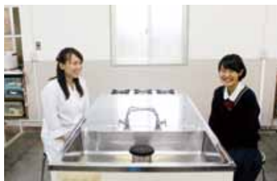
最初は緊張気味でしたが最後は笑顔で。