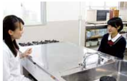
インタビューは懐かしの調理室で行いました。