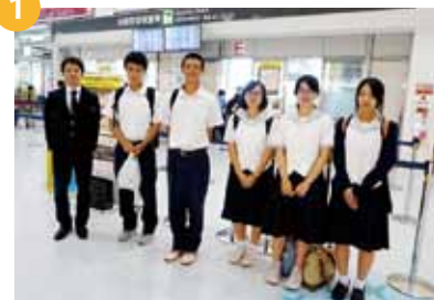
10:50 ~ 13:30... 鹿児島空港～移動①

開講式や早稲田・東大・慶応義塾の見学を体験。東京出張中の尾脇市長も激励にかけつけてくださいました。