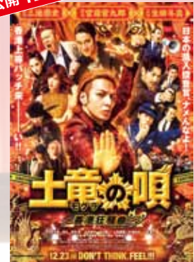
土竜の唄～香港狂騒曲～