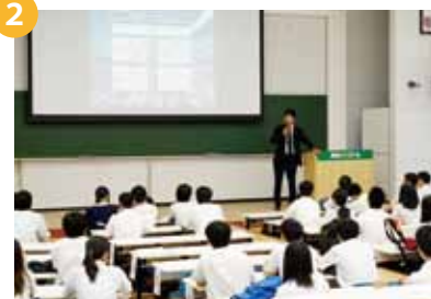
14:40 ~ 15:40... 開講式②