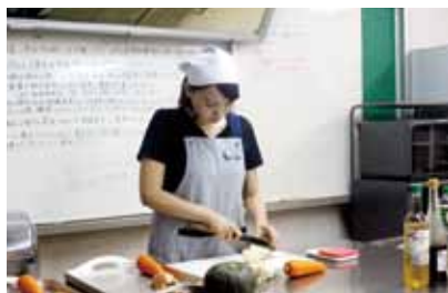
週に一回お料理教室で講師も。撮影日はハロウィンメニュー。