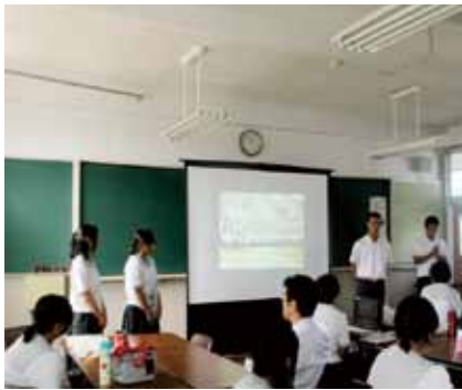
↑他の受講生への報告会の様子