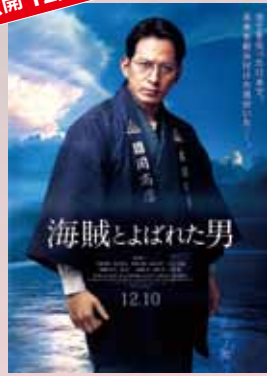
海賊とよばれた男