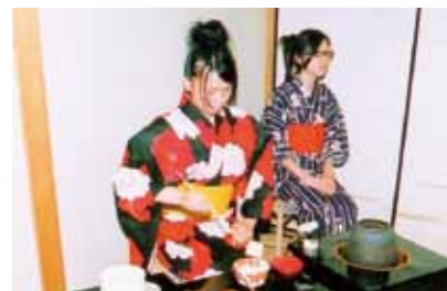
高校時代の真唯さんの写真(左)です。文化祭での茶道部のお茶会の様子です。