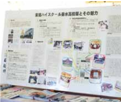
↑生徒たちが作製した東進紹介パネル

今回参加した生徒はこの学部研究会へ参加し本当に良かったと話してくれました。普通の高校生では簡単にはできない貴重な日々を過ごす中で、自分自身の価値観や考え方が大きく変わるような出会いや経験ができ、目標に向かい「やる気スイッチ」が入ったのではないのでしょうか。今回、招待していただいた東進ハイスクールの方々やご協力いただき