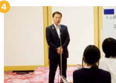
21:00 ~ ... サプライズで市長が激励④