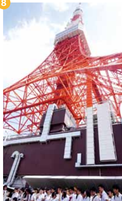
09:00 ~ 10:10... 東京タワー観光⑧

研究会最終日は、東京タワー見学で少しリフレッシュし、最後の大学教授講義を受講し、帰路につきました。