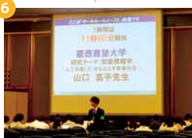
11:00 ~ 16:00... 教授講義（18講座）⑥