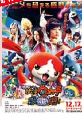
映画 妖怪ウォッチ 空飛ぶクジラとダブル世界の 大冒険だニャン！