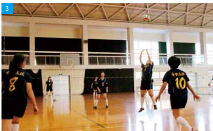
1／部員全員で 2／レシーブ練習 3／勝利を目指して