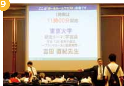
11:00 ~ 14:10... 教授講義⑨