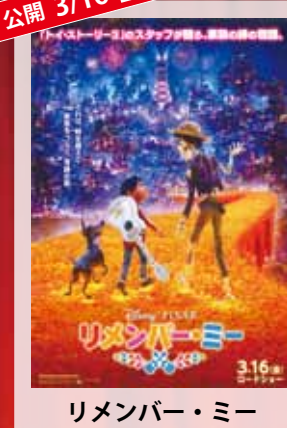
リメンバー・ミー