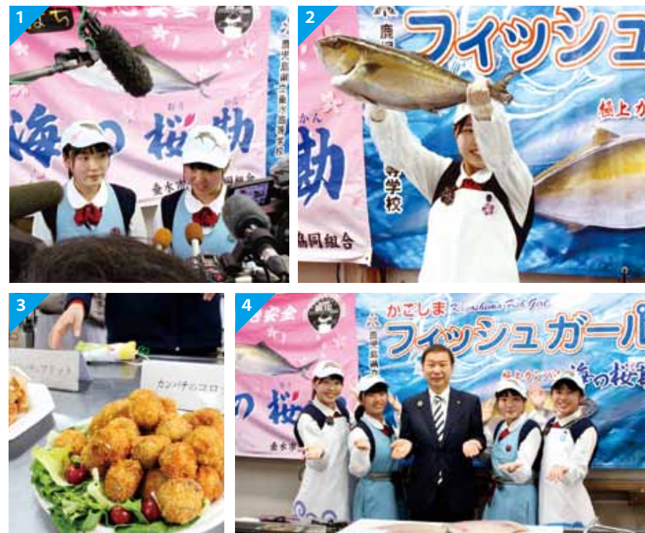
1/取材陣に囲まれ緊張しっぱなしの1年生。 2/お披露目で解体に使用されたかんぱち。 3/かんぱちのアレンジ料理も大盛況。 4/垂水市長も激励。