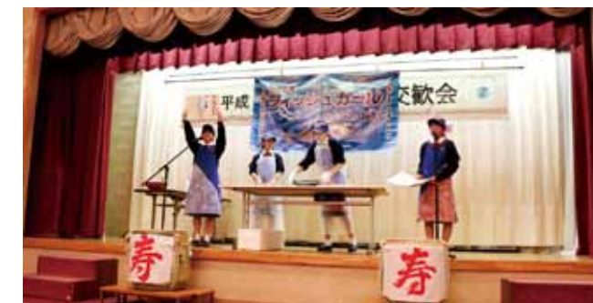
↑垂水市新春賀詞交歓会に出演(1月13日)。3年生にとってはこれが最後のイベント出演になりました。

鹿児島フィッシュガールが結成されて1年。東京三越でのイベントを皮切りに、本誌11号でも紹介したように、沢山のオファーをいただき、「やるからには楽しもう!!」を合言葉に10件以上のイベントに参加させていただいた。各イベントごとにプレゼンにも工夫を凝らし、お魚のPRももちろんのこと、観客のみならずほっこり笑顔になるような彼女たちのイベント。休日返上、「友達と遊びに行きたいな」と思ったこともあったはずなのに嫌な顔一つ見せず、いつも笑顔でパフォーマンス。4人での最後のイベントは今年1月13日に行われた地元垂水市の新春賀詞交歓会。最後が地元でのイベントということでもいつも以上に緊張していた。「イベント中