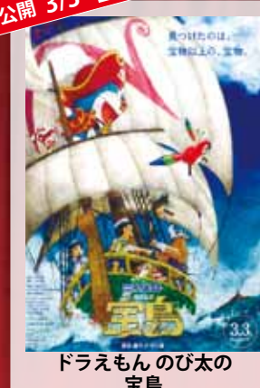
ドラえもん のび太の宝島