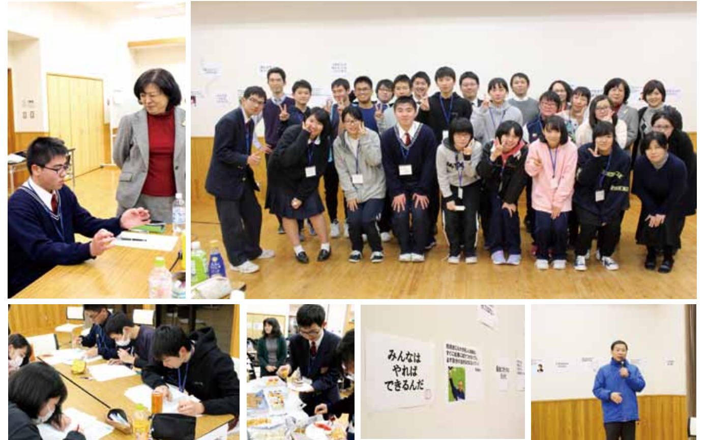
開校式には垂水市長も激励に。(写真右下) / 今年も東進ハイスクール本社から3名の先生方にお越しいただき、合宿を運営していただきました。

東進ハイスクールから送られてきた国語、数学、英語の試験を受け、自分の今の学力を知ることからスタートします。今回、「垂高版東進衛星予備校」は、国、数、英、小論文講座を中心に約30講座の中から、選択し受講することになります。学び直したい科目や、力をつけたい科目を、自分自身で考えて選択します。