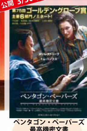
ペンタゴン・ペーパーズ 最高機密文書