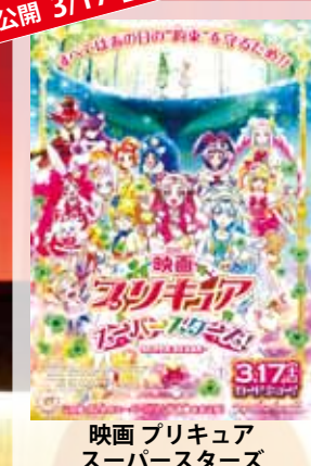
映画 プリキュア スーパースターズ