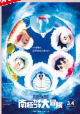
ドラえもん のび太の 南極カチコチ大冒険