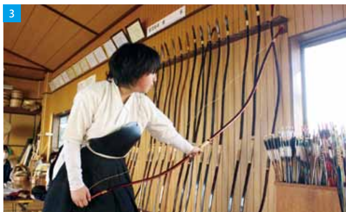
1 / まずは拝礼から 2 / 順手でチーム練習 3 / 弦を張っている様子