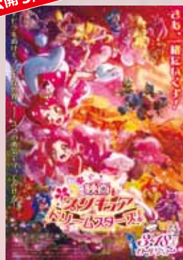
映画 プリキュア ドリームスターズ