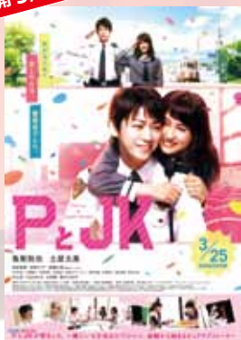
P と JK