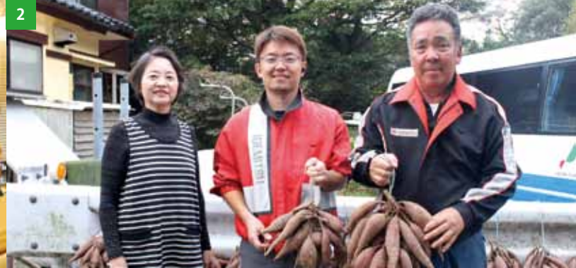
↑お世話になった各事業所様 / 1 たるみず畑さん / 2 宮下商店さん / 3 キッチン垂水さん / 4 レストランウチエさん / 5 垂水市漁業協同組合さん