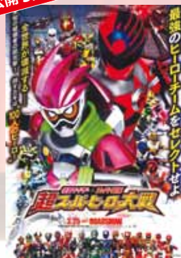
仮面ライダー×スーパー戦隊 超スーパーヒーロー大戦