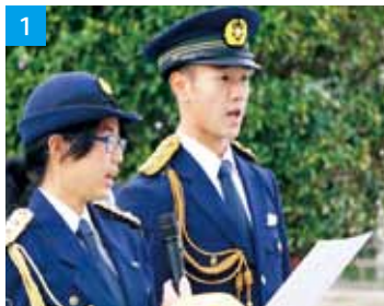
1 / 堂々と宣誓文を読み上げる2人 2 / 2人のかけ声で警戒パトロールへ 3 / 制服のまま校長室へご挨拶

た。決意表明や出発のかけ声など緊張することは多々ありましたが、垂水市の安全と安心に少しでも貢献できればという思いで頑張りました。私たち高校生も登下校中のルールを守り、安全に気を付けていきたいと思えます。」と決意を新たにしています。垂水高校生も自転車通学、バス通学、フェリー通学など様々な交通手段で通学しています。交通ルール、そしてマナー向上を心がけたいと思います。みなさんも、交通ルールを守り、安全に気をつけましょう。