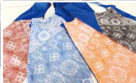
写真右上 / BS ジャパンの取材の様子 右下 / 四季をイメージしたエプロン 左 / 全員での読み合わせ