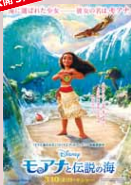
モアナと伝説の海