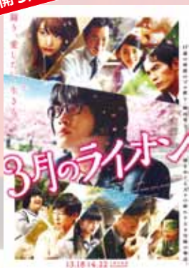
3月のライオン 前編