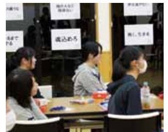
場所は森の駅たるみず。今年は15名の生徒が参加し、昨年に引き続き東進ハイスクールからも3名の方々に参加していただきました。