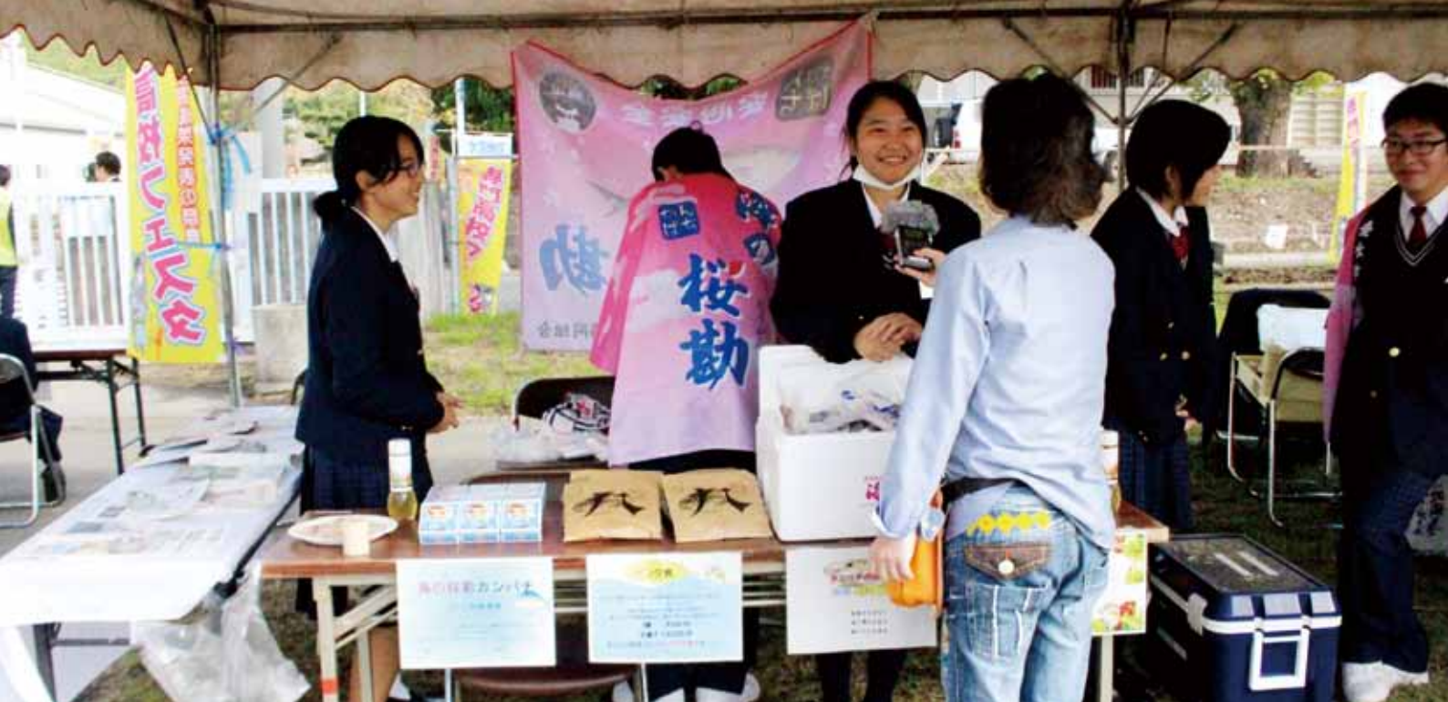
↑今回体験の場となった大隅地区専門高校フェスタ in 垂水高校です！写真は地元「FMたるみず」の取材を受けている様子です。