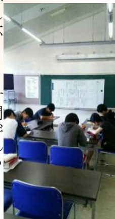
国語のグループ ディスカッションの様子

目的意識を確かなものにし、それに向かって地道に努力することの大切さを感じ、仲間や教師と共に過ごす中で、絆も生まれたと思います。それぞれの進路実現に効果があった「勉強合宿」でした。