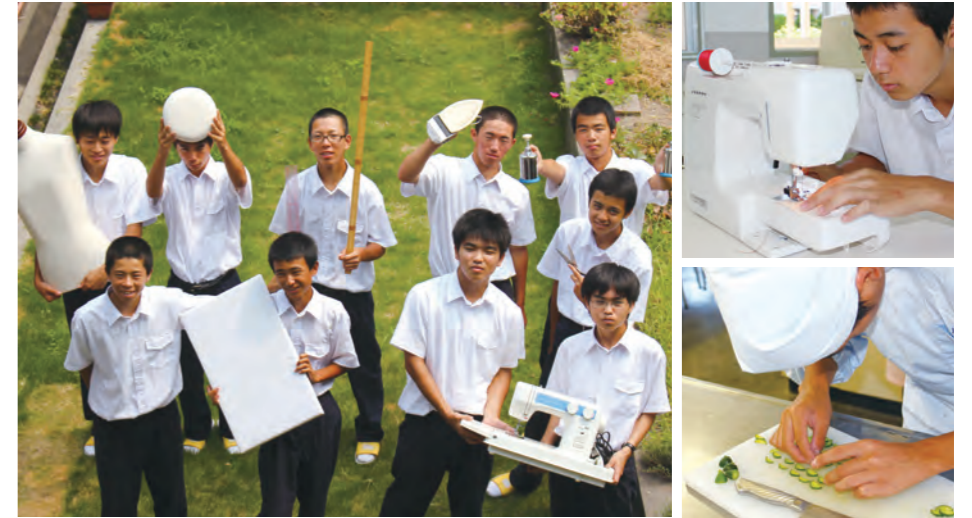
1年生からより専門的な学習を行うため25年度から教育課程を見直しました。ファッション造形基礎・フードデザイン・ビジネスマナーなど専門科目が増え、その基礎をしっかりと学習できます。