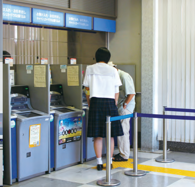
↑ロビー対応ではATM利用のお手伝いも行いました！