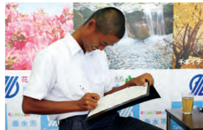
時おり笑顔を見せながら、市長の言葉を書き留める大月生徒会長。