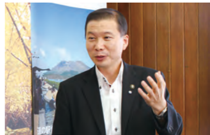
尾脇雅弥/おわきまさや/垂水市長/昭和60年垂水高校卒。当時は野球部。平成23年に垂水市長に就任。