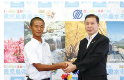
インタビューの最後には握手を交わしました。