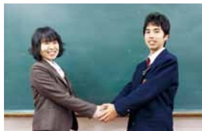
インタビューの最後には握手を交わしました。