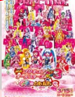
映画プリキュア オールスターズ New Stage 3 永遠のともだち