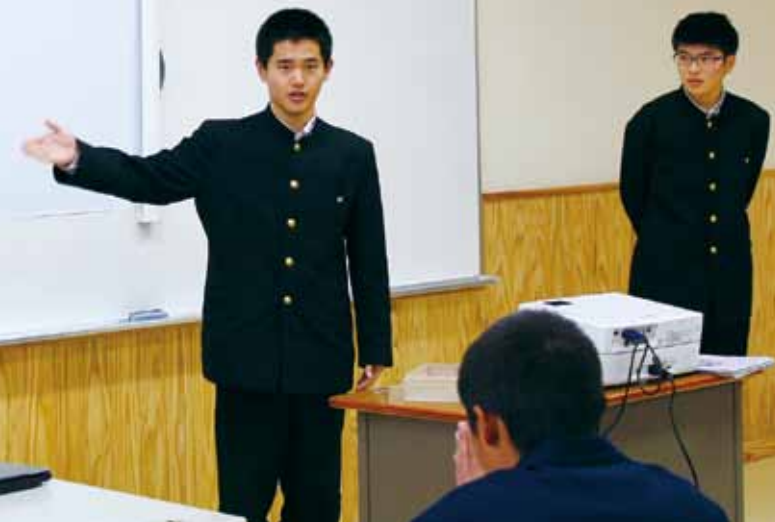
↑ 鹿児島工業高等学校との交流会

説明をしてくださったのは、新旧役員の方々。 工業高校のみなさんは本当に話上手で、とても盛り上がりました。緊張もすっかりとけて、和気あいあいとした交流になりました。