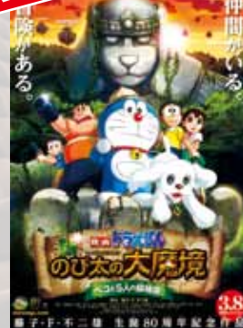
映画 ドラえもん 新・のび太の大魔境