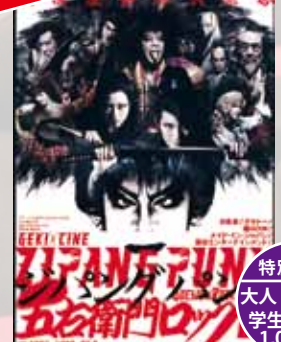
ZIPANG PUNK 五右衛門ロックIII