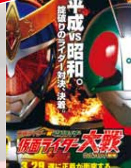
平成ライダー 対 昭和ライダー 仮面ライダー大戦 feat. スーパー戦隊